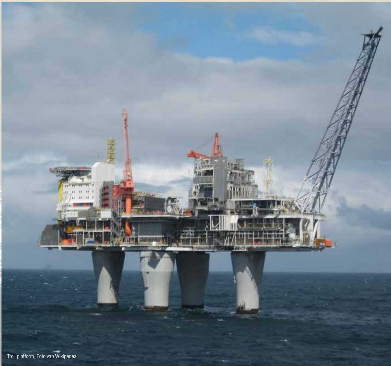
Troll platform

Tot nu toe is de discussie niet in het openbaar gevoerd, maar wat mij betreft komt daar verandering in.” Nu is het woord aan twee partijen: de oliebedrijven enerzijds en de milieuo-organisaties anderzijds. De belangrijkste vraag: durven zij hun hoofd boven het maaiveld uit te steken? „Het is een extreem gevoelige discussie. Zowel de oliesector als de milieclubs zullen zich afvragen of het wel slim is om hier nu in het openbaar voor te gaan strijden.” Shell zal niet weer het horrorscenario van 1995 willen beleven. De reputatieschade door Brent Spar was enorm, en de consumentenboycot kostte ook veel.