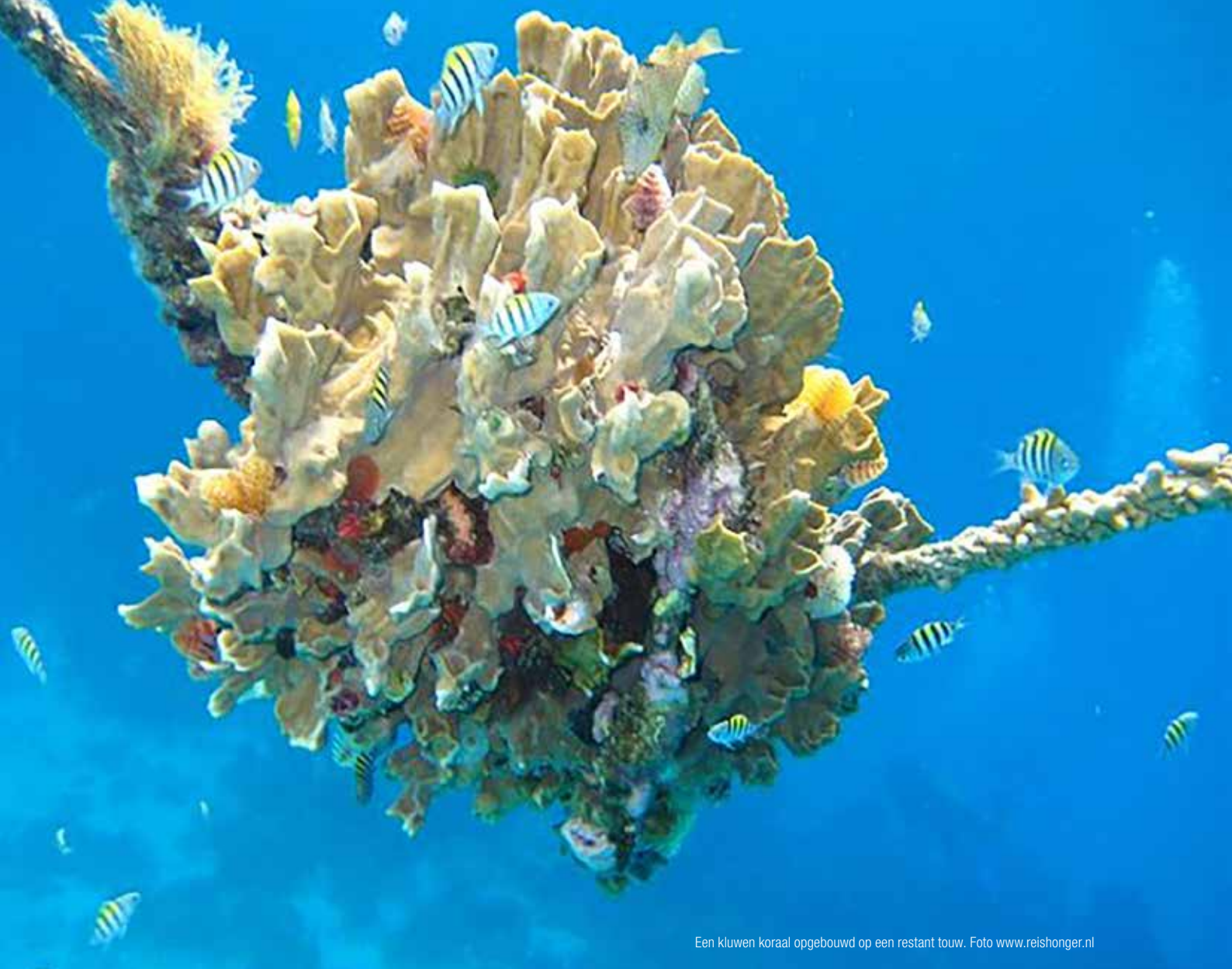
Een kluwen koraal opgebouwd op een restant touw.

De milieuclubs zullen vrezen voor het beeld dat ze zich door de energiesector voor het karretje laten spannen. Een ex-Shellman acht de kans dat de impasse ooit doorbroken wordt klein. Een beslissing moet uiteindelijk van de overheden van de Noordzeelanden komen, verenigd in de organisatie OSPAR. Faulds: „Ik zie gewoon niet in wie hier politiek risico voor wil lopen.