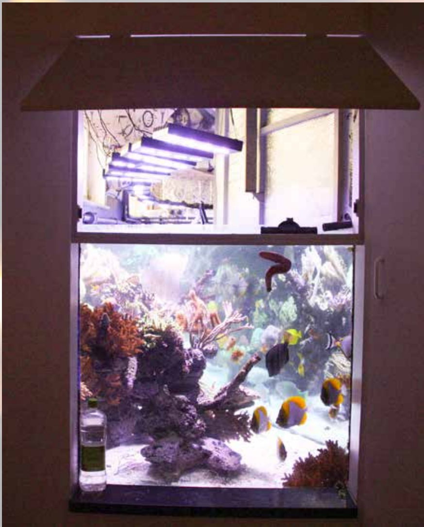
Zijaanzicht met bovenaan de verlichtingsruimte

Er is een automatisch bijvulstelsel met osmosewater om het verdampte water aan te vullen. Er wordt elke maand circa 1000 liter zeewater gewisseld. Dit gebeurt afwisselend met natuurlijk zeewater en met kunstmatig zeewater. Het merk van kunstzout wordt ook steeds afgewisseld. Er wordt zowel met osmosewater als met gedemineraliseerd water gewerkt. De verwarming en een airco houden de watertemperatuur constant. De sporendosering wordt met de producten van Reef Corner gedaan. Er worden ook enkele producten dan de Zeovit-lijn van Korallen-Zucht toegepast, zoals Jodium en Pohl's A-Balance. Regelmatig worden de Kh, het nitraat- en het fosfaatgehalte getest. Om de twee maanden werd een Triton-test gedaan.