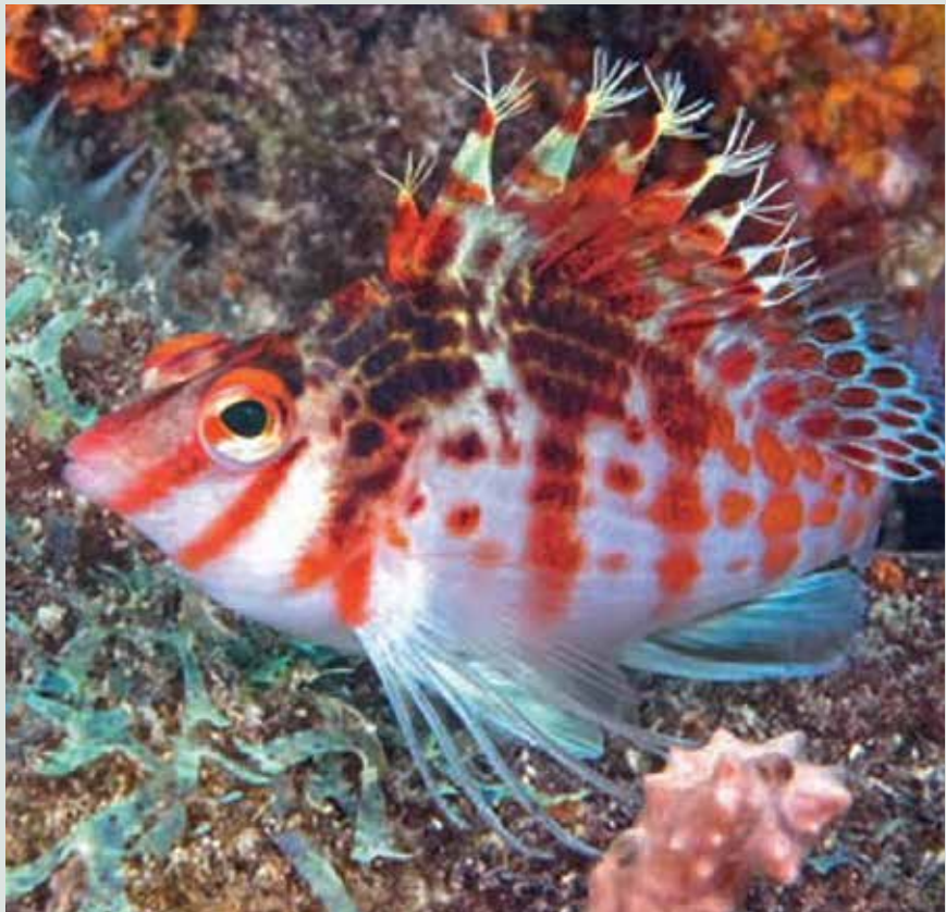
Dwerg koraalklimmer ( Cirrhitichthys falco ). De borsteltjes aan het uiteinde van de rugvinstralen zijn goed zichtbaar.

Koraalklimmers ondergaan gedurende hun leven een geslachtsverandering. Ze worden als vrouwtjes geboren en veranderen als de noodzaak zich voordoet in mannetjes (dat heet 'protogyne geslachtsverandering'). Evenals bij de vlaggenbaarsjes heeft een mannetje een aantal harem-vrouwtjes waarover hij waakt. Tijdens de paaitijd – meestal tijdens het invallen van de duisternis of gedurende de nacht – zwemmen de vissen paarsgewijs naar de waterspiegel. Nadat beide dieren hun voortplantingscellen hebben uitgestoten, vindt daar de bevruchting plaats. De cellen worden door de stroming meegevoerd en over een enorm gebied verspreid.