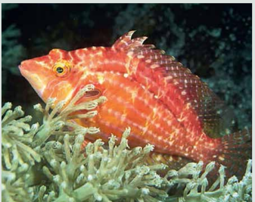
Gouden koraalklimmer Cirrhitichthys aureus