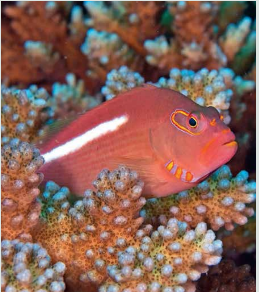
Rode koraalklimmer Paracirrhites arcatus

Dit dier wordt maximaal tien centimeter. Zijn lichaam is bedekt met mooie oranjerode vlekken. Deze soort komt voor tot een diepte van 40 meter. Maar er zijn ook grotere soorten zoals de halfgevekte koraalklimmer, die 29 centimeter wordt en bijna uitsluitend bij oceaaneilanden voorkomt. Naast zijn rode kop en donkere vlekken is een witte lengtestreep typerend voor deze soort, met als variant een kleine, witte vlek. Met zijn 28 centimeter behoort de reuzen koraalklimmer ( Cirrhitites pinulatus ) tot de grote soorten. Hij leeft in zeer ondiep water (0,3-3 meter), dus in de brandingszone, vooral op stenen. Zijn donkere lichaam is bedekt met helderwitte vlekken.