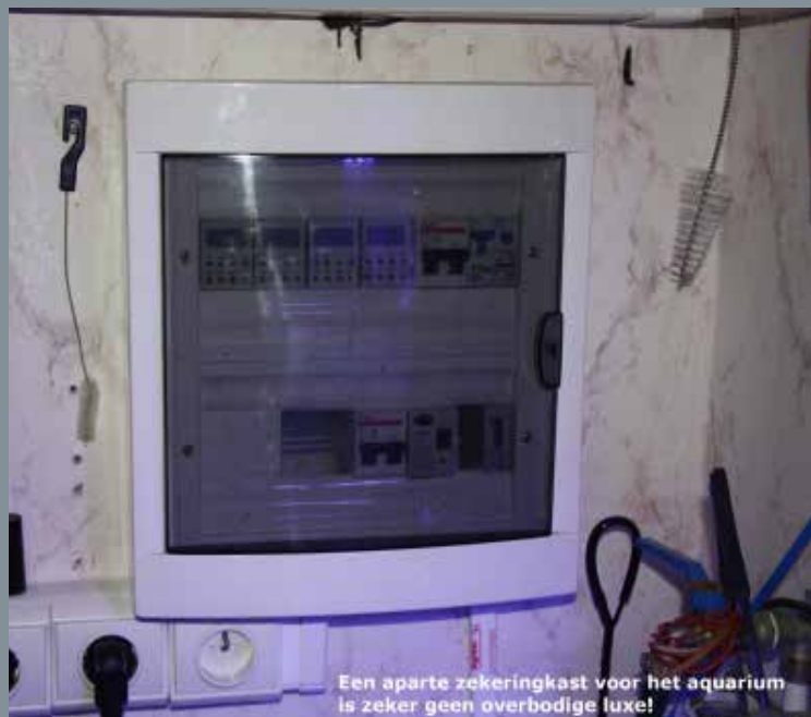
Een aparte zekeringkast voor het aquarium is zeker geen overbodige luxe!